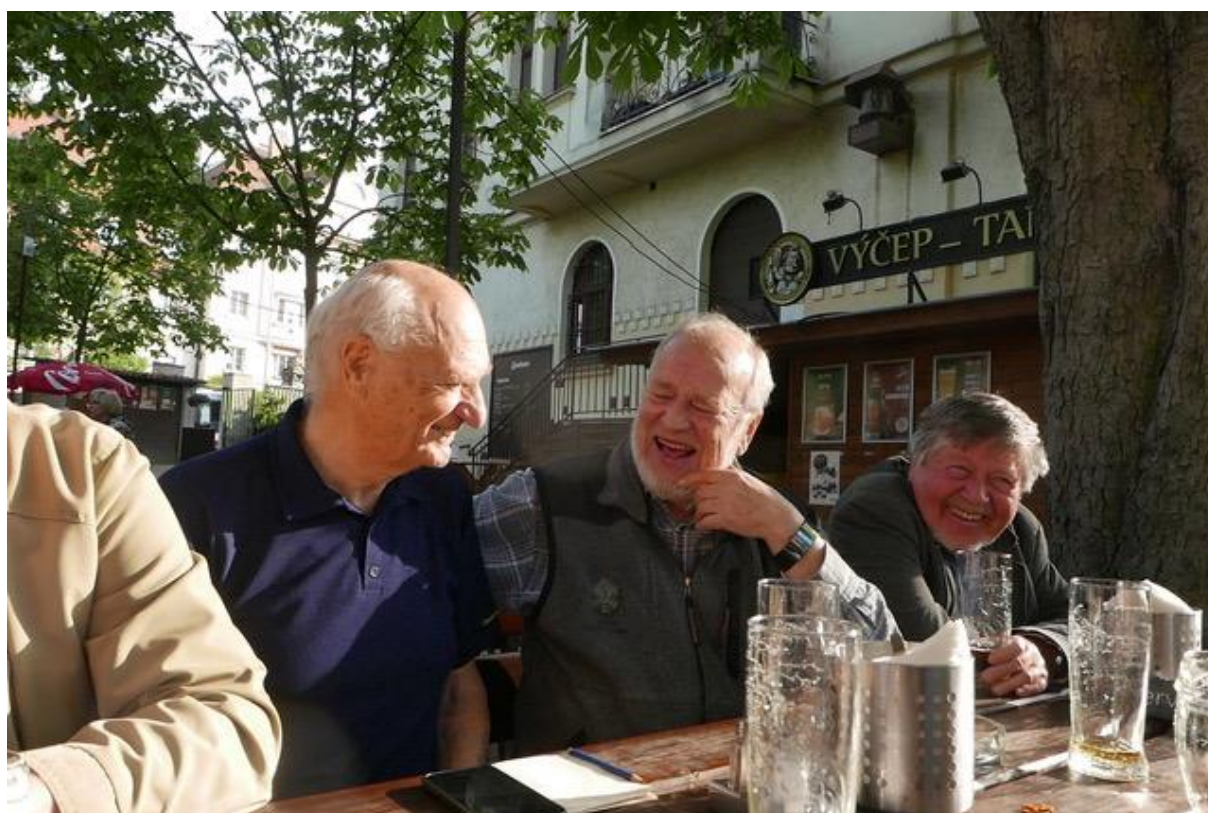
A na závěr důkaz, že bylo veselo.