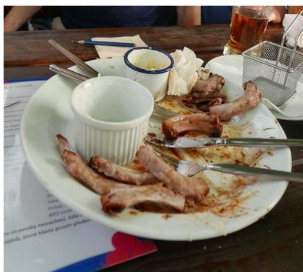
Takto to skončilo