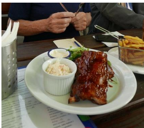
Takto to začalo