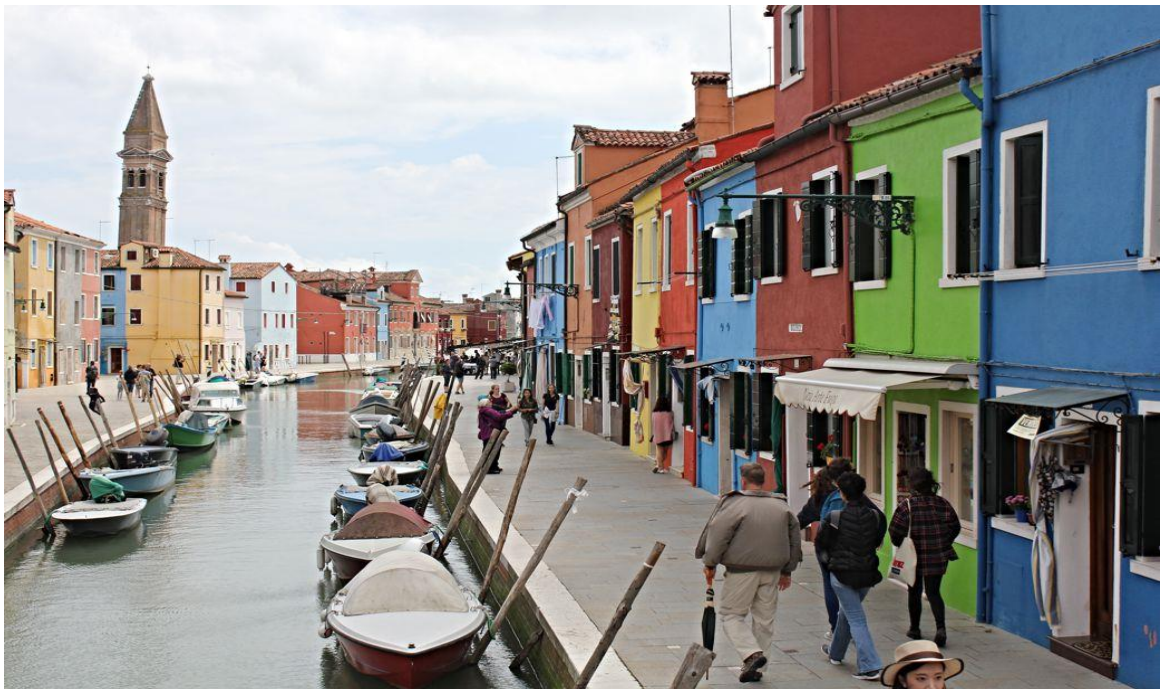
Burano, ostrov v Benátské laguně