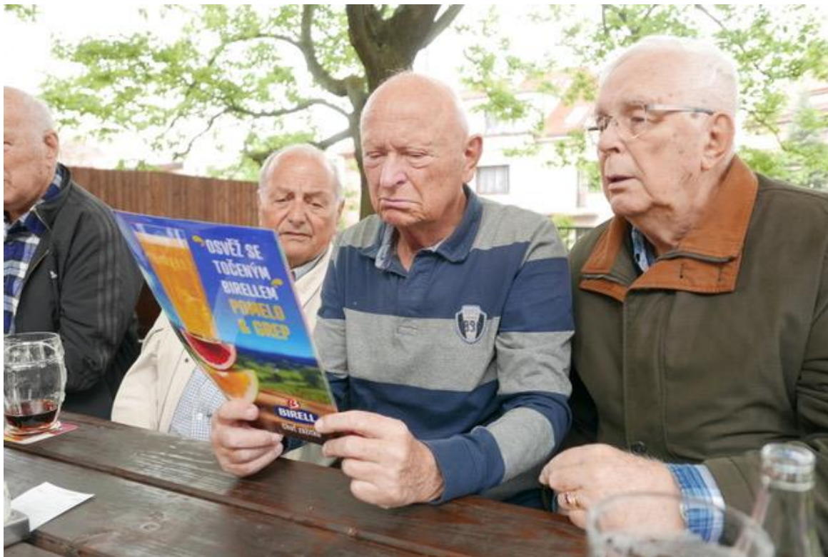
Rozhodování, co si dát, nebylo jednoduché